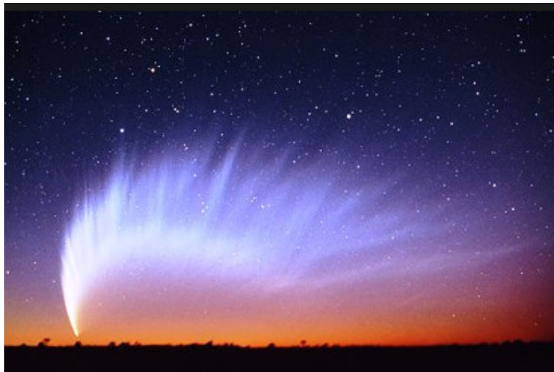
Komeet McNaught in Australië in 2007

Dit najaar verwacht de astronomische wereld het verschijnen van een zeer heldere komeet. Kometen zijn sporadische bezoekers uit de verste regionen van het zonnestelsel. Doorgaans zijn het kleine hemellichamen. De kern van de komeet ISON heeft een diameter van amper 5 km. Maar spectaculair wordt de staart van de komeet in de nabijheid van de zon. Deze staart bestaat uit door de zonnewind weggeblazen ijs en stofdeeltjes. Bij sommige kometen werden staarten tot zelfs 200 miljoen km lang gemeten.