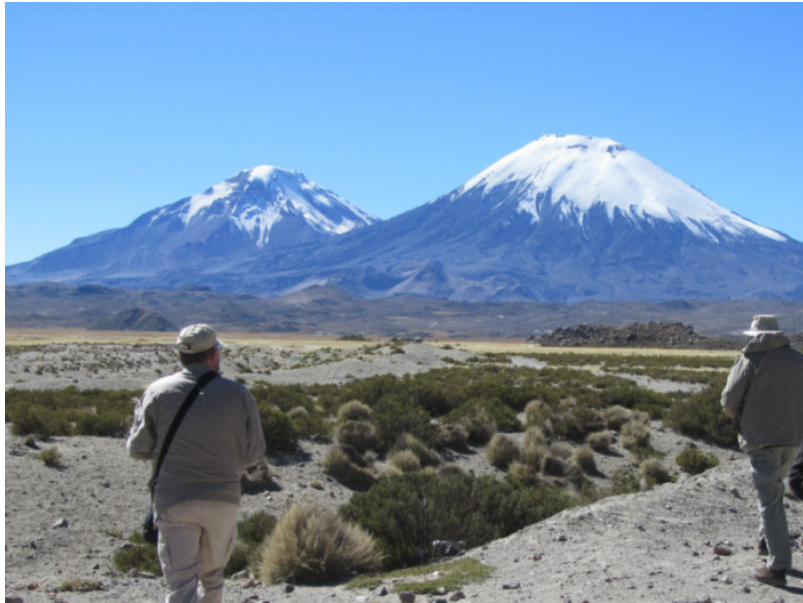
Zicht op de vulkanen Pomerato en Parinacota, bij het Chungara meer.