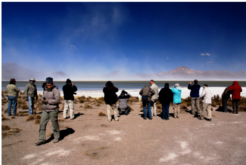
De volgende dag zetten we onze tocht door de altiplano verder via de Salar de Surire. Het is nog steeds bijtend koud en de wind is bijwijlen stormachtig maar dat weerhoudt ons er niet van om te genieten van de onbeschrijfelijk mooie landschappen.