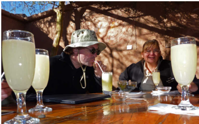
We brengen de rest van de dag door met relaxen in San Pedro de Atacama. Wat door de gezellige straatjes slenteren, souvenirs kopen, terrasje doen én natuurlijk pisco sour drinken.