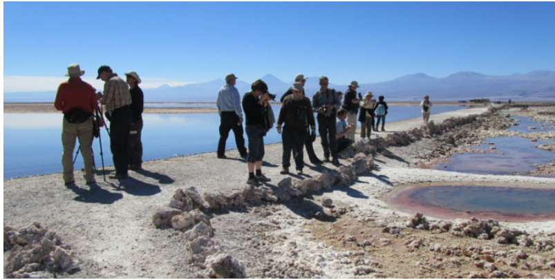
We genieten van het zonnetje en het magnifieke landschap.