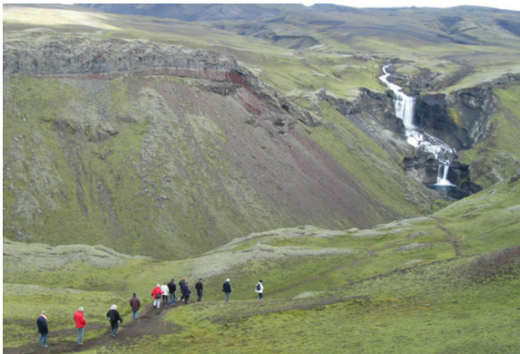
De wandeling door de Eldgja kloof start met een pittige afdaling met prachtig zicht op de Ófærufoss waterval.