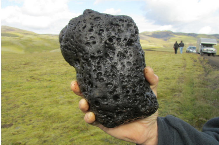
Dit is de boosdoener....